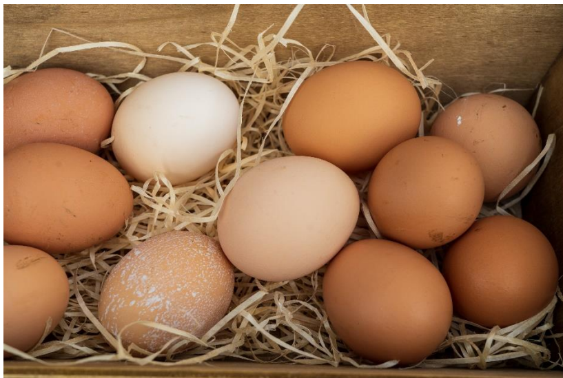
Imagine preluată gratuit de pe Unsplash

3) Se lasă ouăle în pahare câteva ore (între timp, se poate continua desfășurarea altor activități școlare), după care se analizează starea fiecărui ou din fiecare pahar.